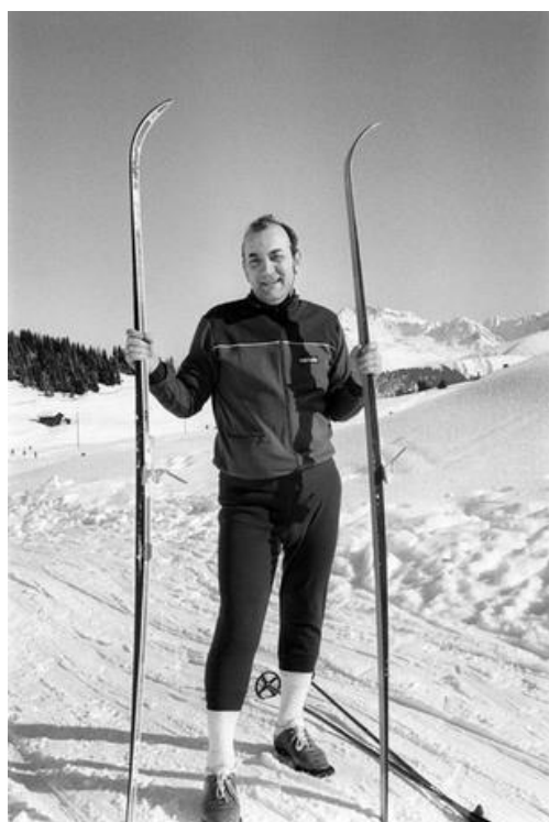
Viktor Korchnoi adapting to Swiss life

→ Training der Schweizer Schach-Nationalmannschaft in Bern 1992: